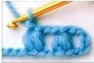
Muestra del punto