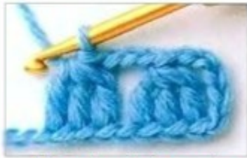
Muestra del punto