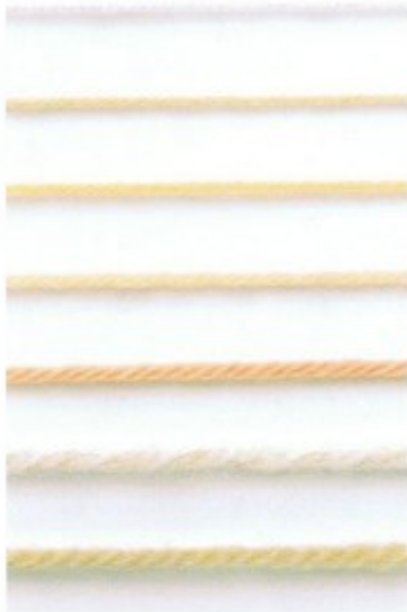
Hilado con bucles

Lo ideal cuando comenzamos, es escoger hilados gruesos que nos permitan ver con facilidad los puntos para poder contarlos y saber dónde picar la aguja.