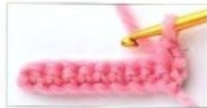
revés del punto