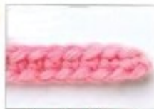
derecho del punto