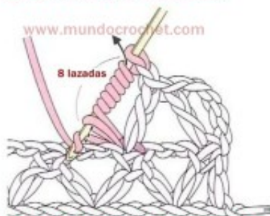
3) Sin soltar la lazada, la pasamos por 8 de las lazadas que nos quedaron en la aguja.