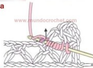
2) Tomamos otra lazada y la pasamos por el punto.