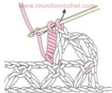
4) Nos quedan 2 lazadas en la aguja. Tomamos 1 lazada y la pasamos por las 2 lazadas cerrando el punto.