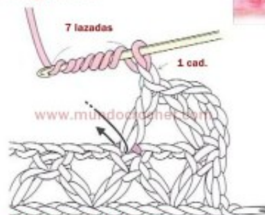
1) Tomamos 7 lazadas y picamos la aguja en el punto de base.