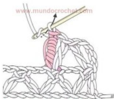
5) Para continuar con el punto fantasía, tejemos 1 cadena.